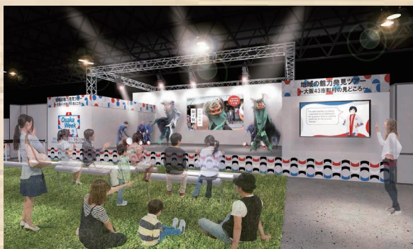
ステージイベントイメージ図