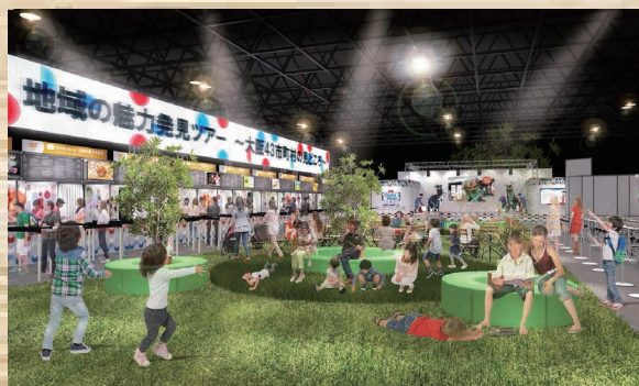
食べなはれゾーンイメージ図