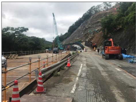
▲福住側の仮橋の設置工事