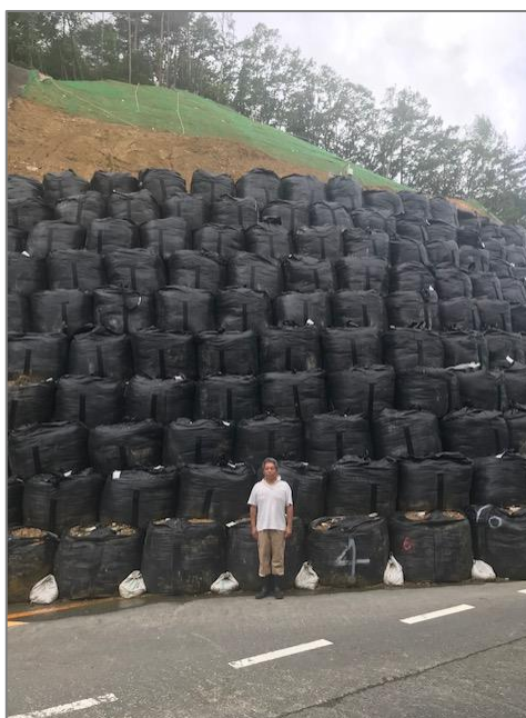
▲天王側のフレコンバックによる土留め(拡大)