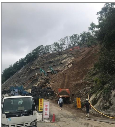
▲福住側の法面保護工事