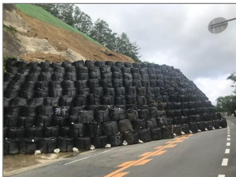
▲天王側のフレコンバックによる土留め