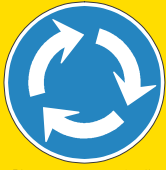
「新設される道路標識」