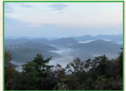
(歌垣山から見る雲海)

それを支えているのは町の方々の日々の営みの賜物であり、今後も私もその一人でありたいと願っています。