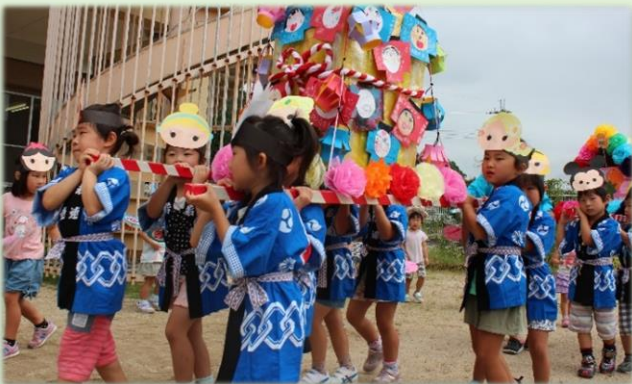
みんなで作ったおみこしを運動場で「わっしょい！！」