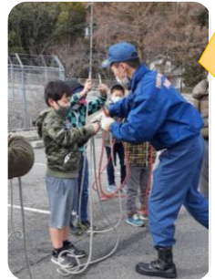
縄の結び方などを教えてもらいました。