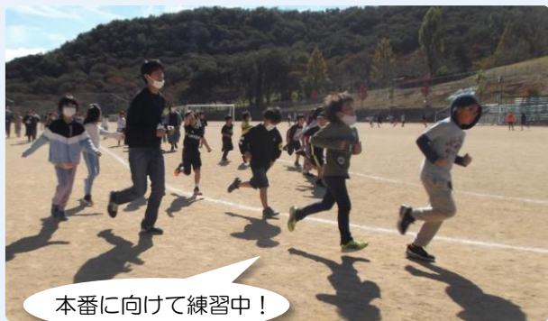
本番に向けて練習中！

運動場→芝生広場→学びの丘→駐車場上部→ 第2ゲート→運動場の周回コース 1～4年生:1周(1,150m) 5・6年生:2周(2,150m)