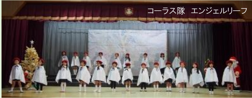
コーラス隊 エンジェルリーフ