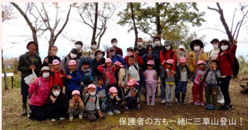
保護者の方も一緒に三草山登山!

12月11日(土)生活発表会でした。劇遊び「スイミー」の世界をたっぷり遊びました。