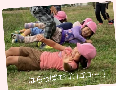
はらっぱでゴロゴロ～!