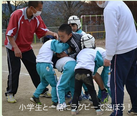
小学生と一緒にラグビーで遊ぼう!