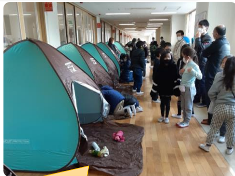
避難所生活を想定してテントを張りました。