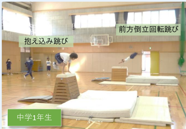
前方倒立回転跳び