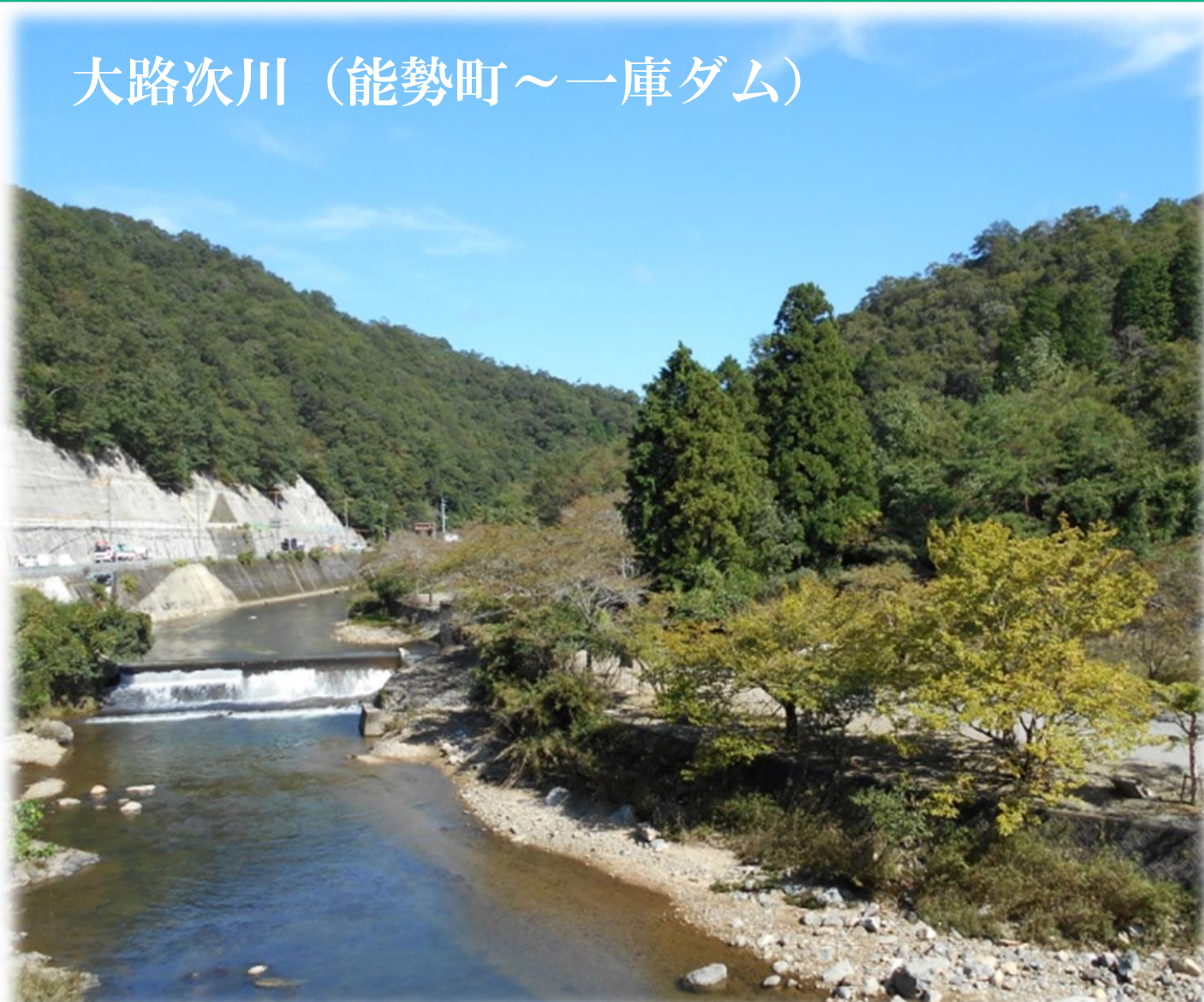
大路次川（能勢町～一庫ダム）

都市近郊で豊かな自然の残る大路次川では、夏になると鮎釣りを楽しむ方や、川沿いのキャンプ場で、バーベキューを楽しむ家族連れなどが訪れます。