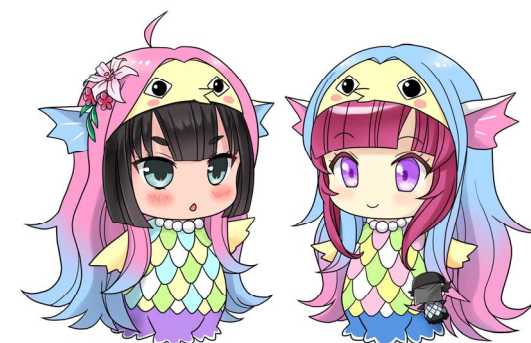
能勢PR キャラクター 「お浄・るりりん（アマビエver）」