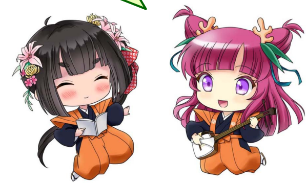
能勢PRキャラクター 「お浄・るりりん」