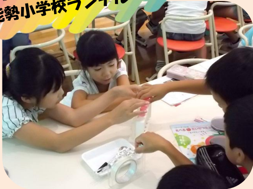
ちよこっと検査体験(微生物のしくみや細菌を学ぶ)

元気広場 Part1 は 7月26・27・30・31日に開催 人形劇や体験プログラム、その後は待ち遠しい昼食！ みんなで和気あいあいと過ごしました。