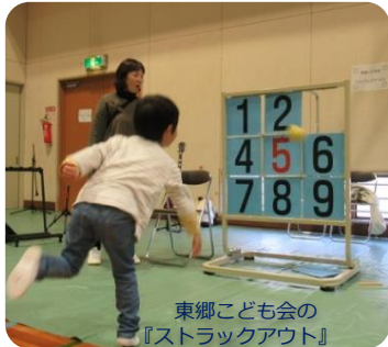
東郷こども会の『ストラックアウト』

「地域のこどもは地域で育てる」 をスローガンに、地域教育協議会 の大人のネットワークを活用し、 地域の教育力を活性化するための イベントが開催されました。