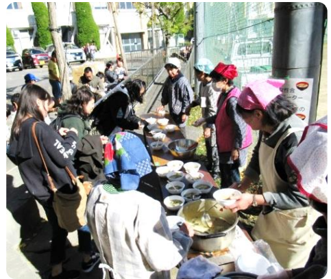
地域コーディネーター、更生保護女性会の『ふるまいコーナー』豚汁とアルファ化米

当日は家族やお友達を誘って多くの人が参加されました。 高校生による軽音楽やダンスなどの舞台発表は拍手喝采！ 遊びや工作コーナーでは子どもから大人まで、笑い声が飛び交っていました。 イベントの後にはくじ引き大会がありとても盛り上がりました。