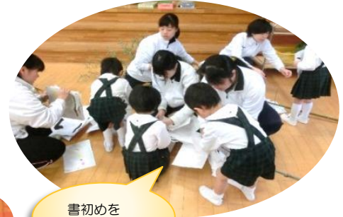
書初めを 竹に通そう

書初めを竹に通して燃えていく炎と天高く舞い上がる煙を見つ めながら、今年1年の健康と幸福を願います。