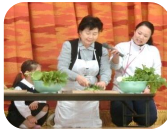
七草を刻んでいます。

♪トントントン、 トントントン唐土の鳥が 日本の土地に渡らぬうちに ばたくさーばたくさー♪